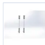
14771 SOSPENSIONE MONO/BI LAMPADA