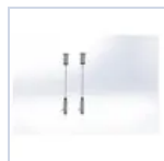
14771 SOSPENSIONE MONO/BI LAMPADA