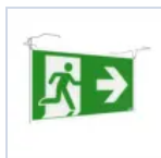
4127 SCHERMO BAND PRATICA SX/DX