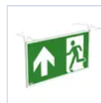
4129 SCHERMO BAND PRATICA UP