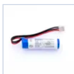
415437001 LI-FEPO4 3.2V 0.6AH 14500