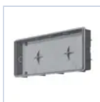
2741 INC COMPL 6-11 3974/IP