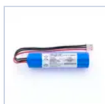
415436001 LI-FEPO4 3.2V 1.5AH 18650