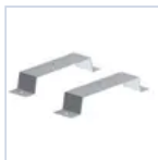
2751 KIT INST CONTROSOFO COMPL