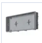
2741 INC COMPL 6-11 3974/IP