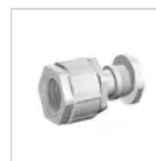
3727 GR PRESSATU 16/20- 4003/RG