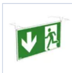
4128 SCHERMO BAND PRATICA BS