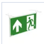
4129 SCHERMO BAND PRATICA UP