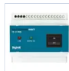
2730 INIBIT 973 COMANDO R.MODE