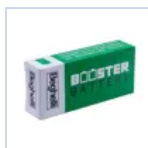
RA13 BOOSTER BAT LiFe 6.4V 1.5Ah