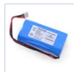
415441001 LI-FEPO4 3.2V 3AH 18650