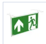
4129 SCHERMO BAND PRATICA UP