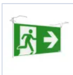
4127 SCHERMO BAND PRATICA SX/DX