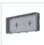
2741 INC COMPL 6-11 3974/IP