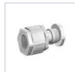
3727 GR PRESSATU 16/20- 4003/RG