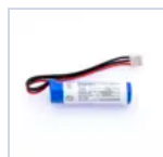
415437001 LI-FEPO4 3.2V 0.6AH 14500