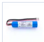
415436001 LI-FEPO4 3.2V 1.5AH 18650