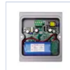
15069 MODULO TR 6W 1/3H PROIETTORI