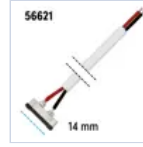
56621 CONN STRIP TO DRIVER 5PZ