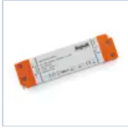
4711 DRIVER ISOLATO 24V IP20 75W