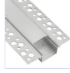
56693 KIT PROF CARTONGESS RASAT LARGO