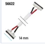
56622 CONN STRIP TO STRIP FILO 4PZ