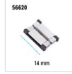
56620 CONN STRIP TO STRIP 10PZ