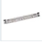
4721 DRIVER PUSH TO DIM 24VIP20 30W