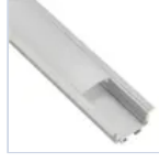
56695 KIT PROF 2MT STRIP INCASS