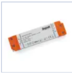
4709 DRIVER ISOLATO 24V IP20 30W