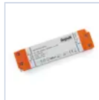
4720 DRIVER ISOLATO 24V IP20 320W