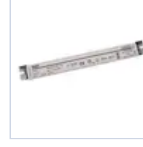
4722 DRIVER PUSH TO DIM 24VIP20 60W