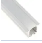
56696 KIT PROF INC FONDO CARTONGESS