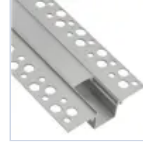
56692 KIT PROF CARTONGESS RASATURA