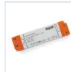
4714 DRIVER ISOLATO 24V IP20 200W