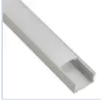
56694 KIT PROF 2MT STRIP PLAFO