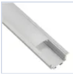
56695 KIT PROF 2MT STRIP INCASS