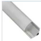
56627 KIT PROFILO 2MT STRIP ANG