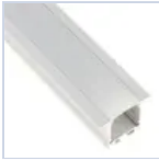
56696 KIT PROF INC FONDO CARTONGESS