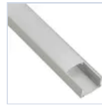
56694 KIT PROF 2MT STRIP PLAFO