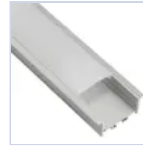
56691 KIT PROF CARTONGESS CON MOLLE