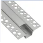
56692 KIT PROF CARTONGESS RASATURA