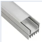
56628 KIT PROFILO 2MT STRIP DISSIPAT