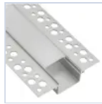
56693 KIT PROF CARTONGES RASAT LARGO