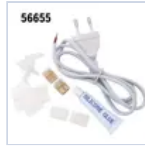
56655 KIT ALIM PER COD.DA56680A56687