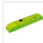
19358 INV P&L LED SE/SA 1H 20-60V