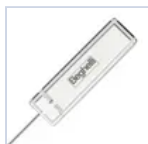
15037 MODULO LGFM