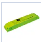
19359 INV P&L LED SE/SA 3H 20-60V