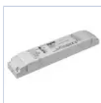
19398 INV UNIV AT RM 5W 20-240V