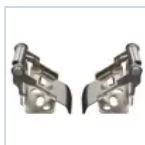
70049 CLIPS UNIVERSALE CGESSO M600