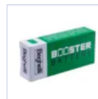
RA13 BOOSTER BAT LiFe 6.4V 1.5Ah