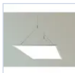
70033 SUSPENSION WIRE PANELED