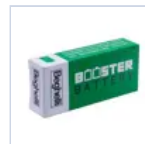
RA13 BOOSTER BAT LiFe 6.4V 1.5Ah