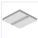
20101 KIT FRAME PLAF BACKLITE 30X120