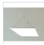
70033 SUSPENSION WIRE PANELED