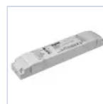
19398 INV UNIV AT RM 5W 20-240V