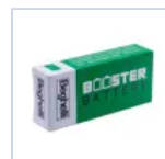
RA13 BOOSTER BAT LiFe 6.4V 1.5Ah