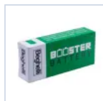
RA13 BOOSTER BAT LiFe 6.4V 1.5Ah