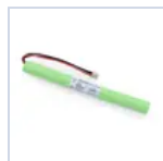
415457001 LI-FEPO4 3.2V 1.5AH PCM- ASTICK