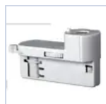
4319 KIT BINARIO TRIFASE UP LED