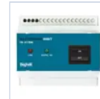
2730 INIBIT 973 COMANDO R.MODE