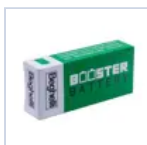
RA13 BOOSTER BAT LiFe 6.4V 1.5Ah