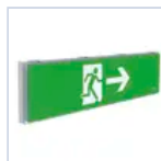
11584 ADES DX TICINQUE LED