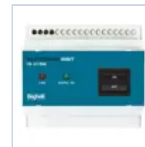
2730 INIBIT 973 COMANDO R.MODE