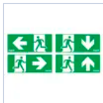
11593 ADES USCITA A SN TICINQUE 18