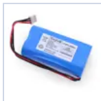
415441001 LI-FEPO4 3.2V 3AH 18650