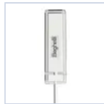
15048 MODULO RM PLUG