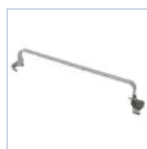
20123 ACCIAIO EX STAFFA ORIENTABILE