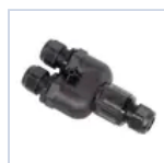
15019 RACCORDO DOPPIO INGRESSO M20