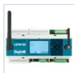
21102 CENTRALE DOMOTICA SD- LGFM