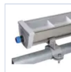
20125 ACCIAIO EX STAFFA PALO