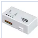
20108 RICEVITORE RADIO SMART