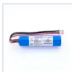
415436001 LI-FEPO4 3.2V 1.5AH 18650