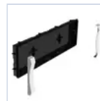
19048 SCAT INCASSO + CORNICE F65 EX