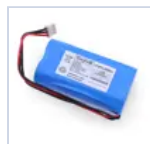
415441001 LI-FEPO4 3.2V 3AH 18650