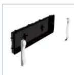
19040 INCASSO + CORNICI F65