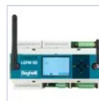
21102 CENTRALE DOMOTICA SD- LGFM