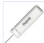
15022 MODULO RADIO DOMOTICO