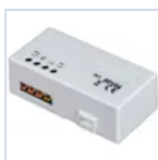
20104 TRASMETTITORE RADIO DOMOTICO