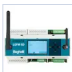
21102 CENTRALE DOMOTICA SD- LGFM