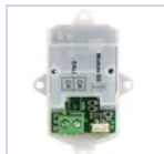
15024 MODULO DALI/PUSH TO DIMM