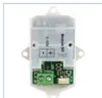
15034 MODULO 1-10V