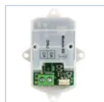
15024 MODULO DALI/PUSH TO DIMM