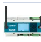
21102 CENTRALE DOMOTICA SD- LGFM