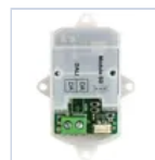
15024 MODULO DALI/PUSH TO DIMM