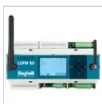
21102 CENTRALE DOMOTICA SD-LGFM